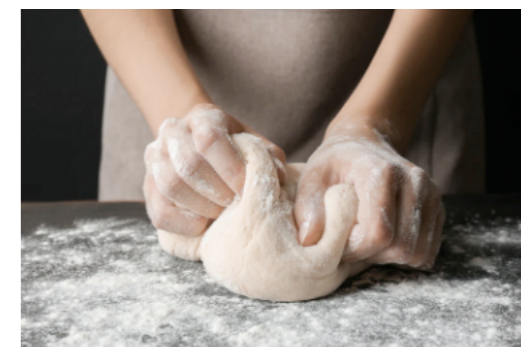
Souplesse, malaxage, dégazage

Là, nous nous disons que nous avons dû rater kekchoz. Tiens, je vais prendre un AGFIP au chocolat et une 2042 pas trop cuite.